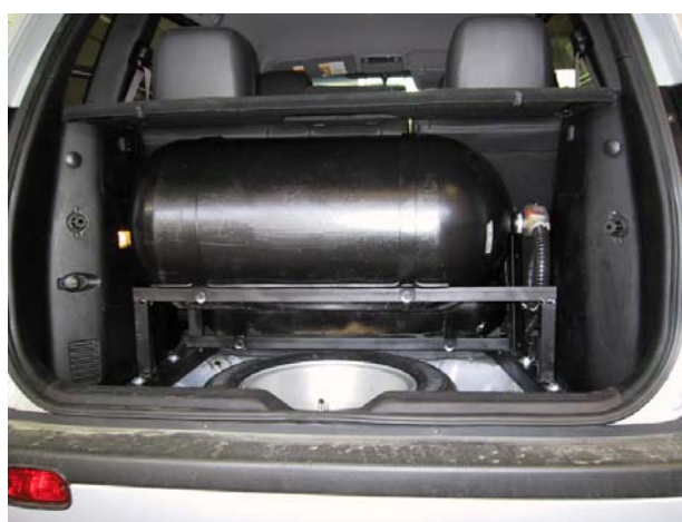
Installazione delle bombole metano