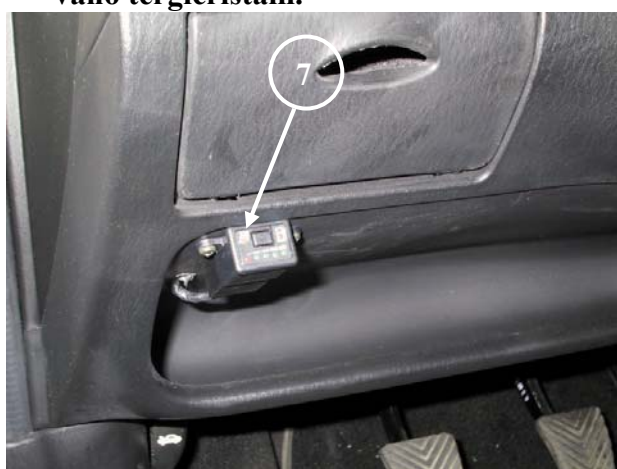
7) Posizione del commutatore