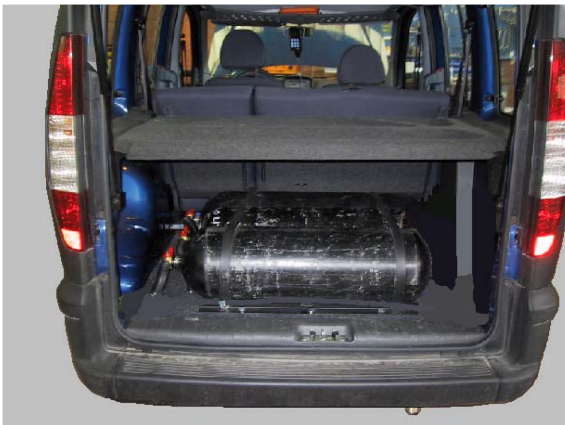
Installazione bombole metano.