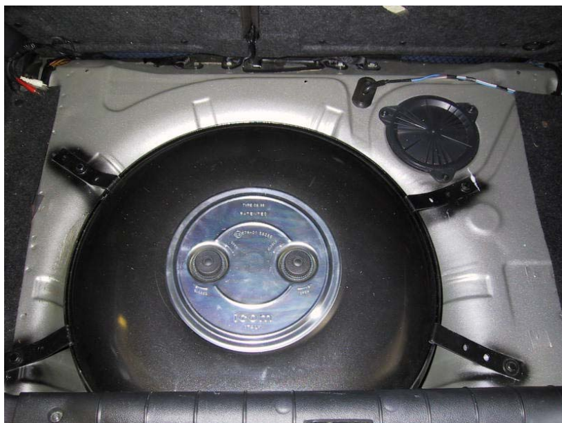
Installazione serbatoio del gas