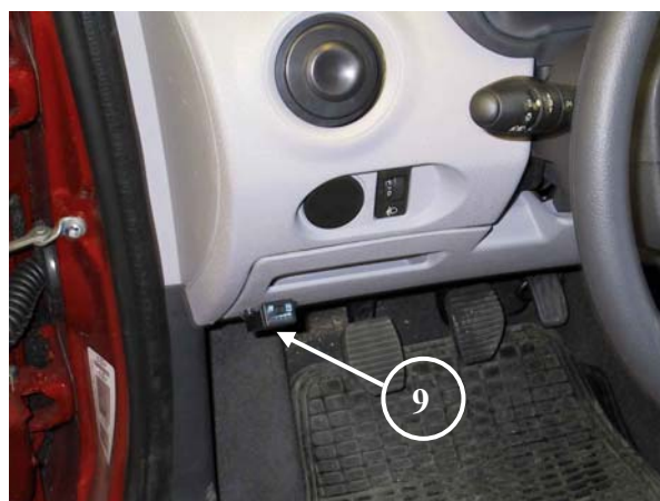
9) Posizione commutatore