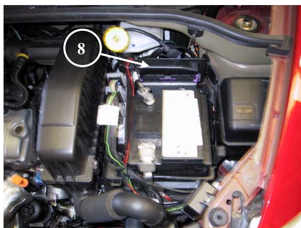
8) Centralina elettronica del gas