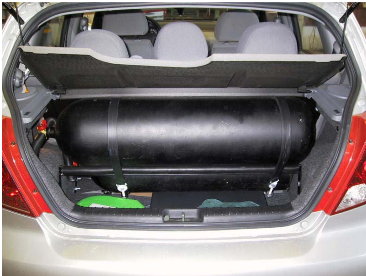
Installazione bombole metano.