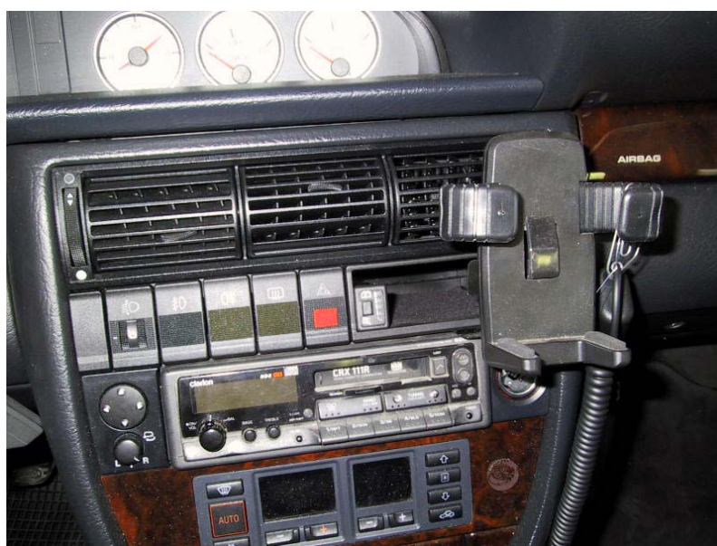
Posizione del commutatore.