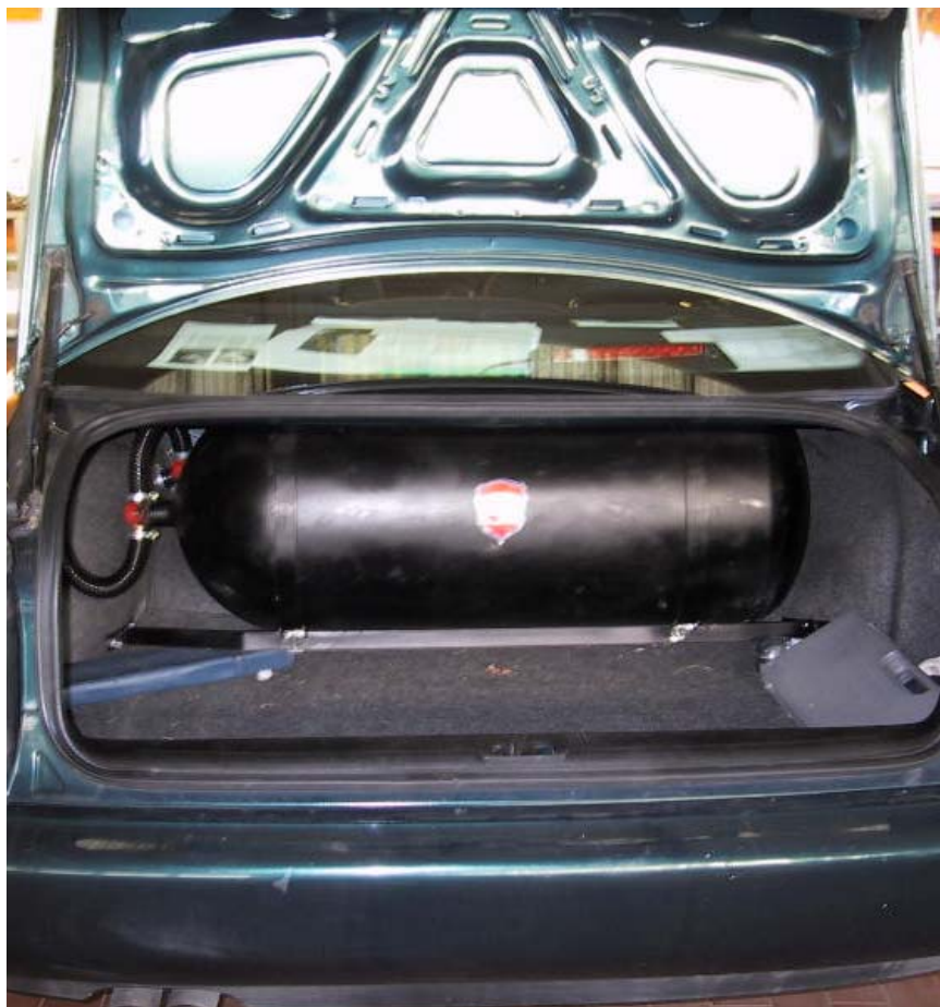
Installazione bombole metano.