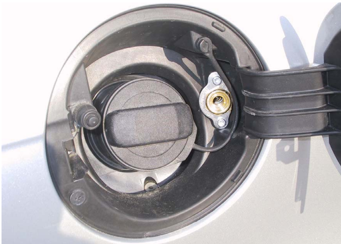
Posizione valvola di carica del gas