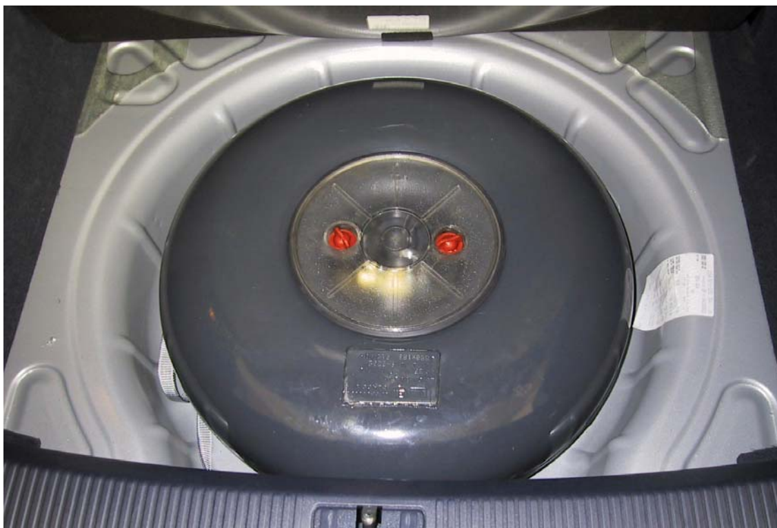
Installazione serbatoio del gas