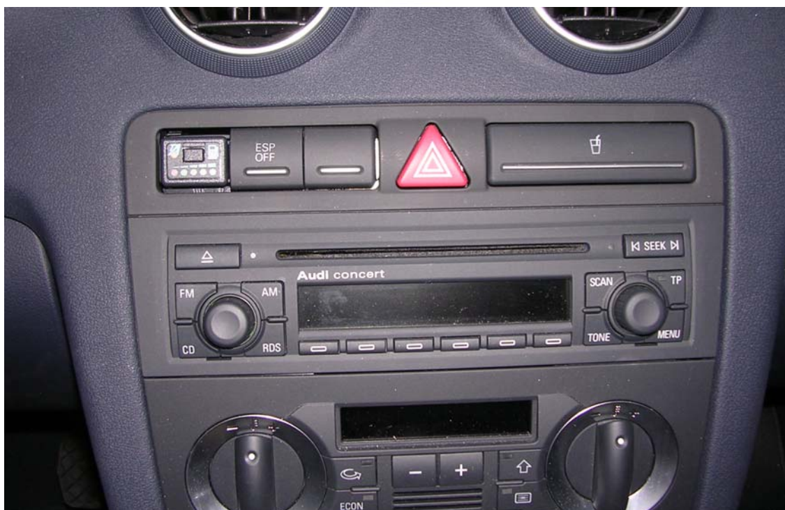
Posizione del commutatore