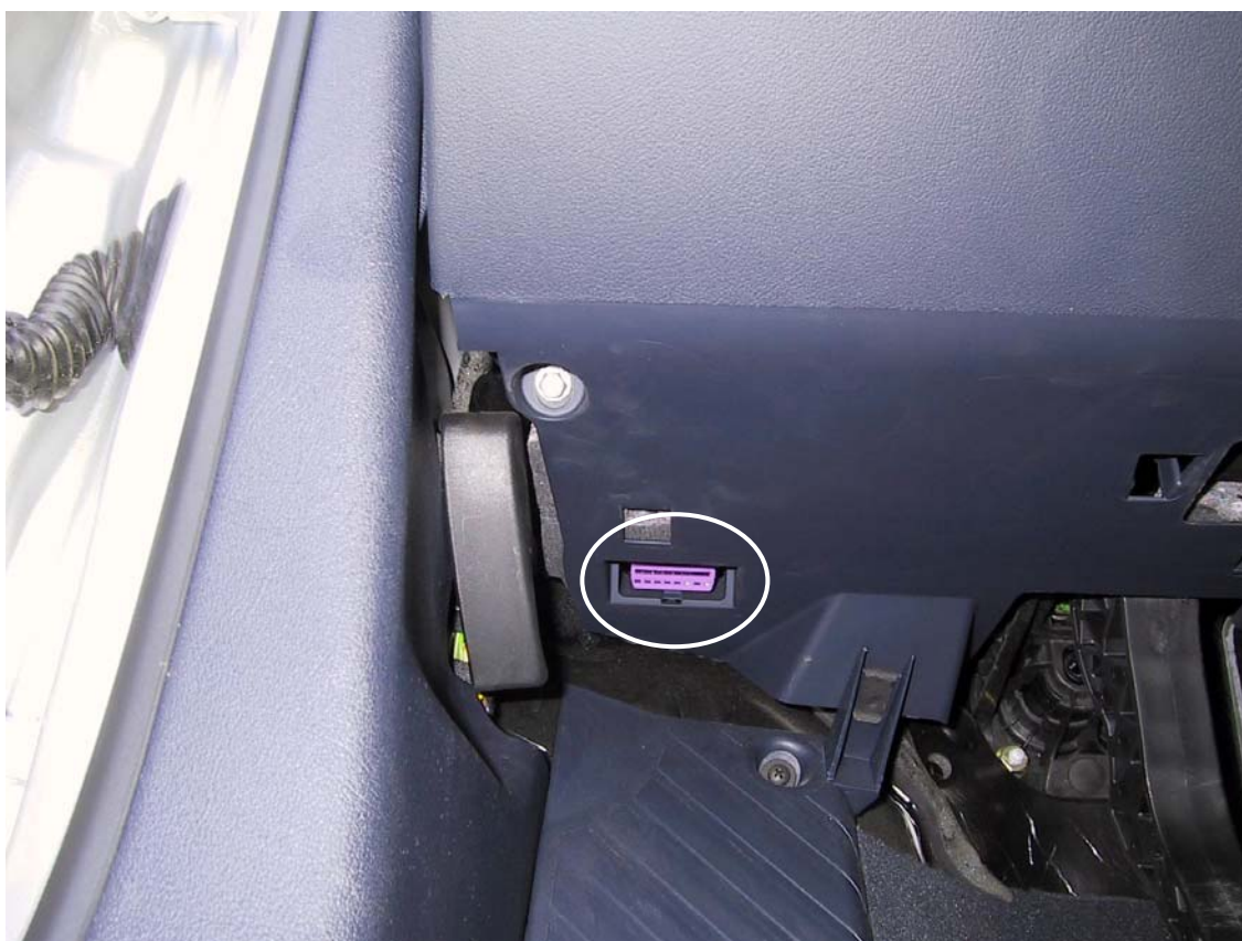
Posizione presa OBD